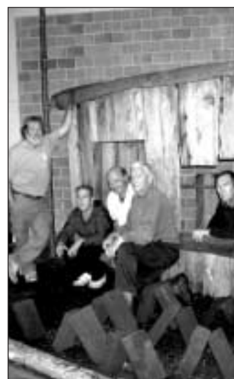
Au milieu des marais à Paroisse Centre. Une belle reconstruction.

L'expo 2004 de la Myco, demain et dimanche, à Paroisse Centre, promet d'être une sacrée cuvée. Non seulement parce que la diversité des espèces, reflet d'une riche saison mycologique, sera au rendez-vous, mais aussi par l'exposition thématique présentée dans le hall d'entrée de la grande salle. Elle a été montée, par des membres bénévoles, sur le thème des tourbières d'antan. Le résultat sera frappant de vérité, avec la reconstruction d'une portion de marais, au pied d'une ancienne cabane, où le visiteur retrouvera l'exploitation à l'ancienne du marais. Les briques de tourbe extraites sont adossées en chalets, puis montée en mailles. Les outils alors utilisés, comme le fendoir, le gazon et la brouette complètent le décor enrichi de la faune typique de ces biotopes, grâce à la collaboration du Musée d'histoire naturelle du Locle. Cette exposition, enrichie de panneaux sur la création, la vie du marais est très didactique, riche en rensei-